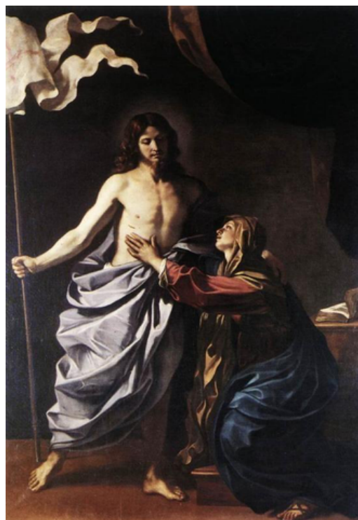
(“Cristo Risorto appare alla madre”, Guercino, 1628-1630, Pinacoteca di Cento)

(Omelia del Santo Padre Benedetto XVI, 23 marzo 2008)